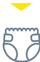
Objets divers : Couches, mégots, coton tiges, protections hygiéniques...