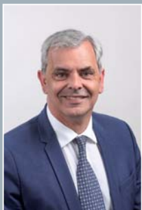
Christophe BOUCHET Président de TOURS HABITAT 1er Vice Président de TOURS MÉTROPOLE VAL DE LOIRE Maire de TOURS