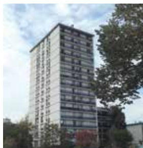
Prochainement en travaux la résidence, 5, allée des Granges St Martin

Fin prévisionnelle des travaux mi-décembre 2017