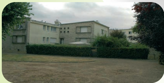
2 ème tranche de réaménagement avant le démarrage des travaux.