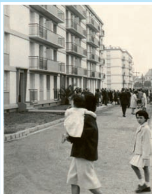
La Rotonde et ses premiers habitants en 1961.

▼ Monique : rencontrée à la sortie de la pharmacie, « j'habite ici depuis quelques années. Les logements sont corrects et les bâtiments bien entretenus. C'est une cité tranquille, je trouve les gens plutôt solidaires. Je sais qu'il y a des habitants qui se plaignent parfois d'être un peu isolés. Pourtant, il y a le bus et nous ne sommes pas très loin de la gare ».