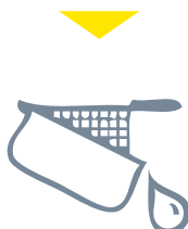
Huiles et graisses