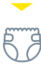
Objets divers : Couches, mégots, coton tiges, protections hygiéniques...